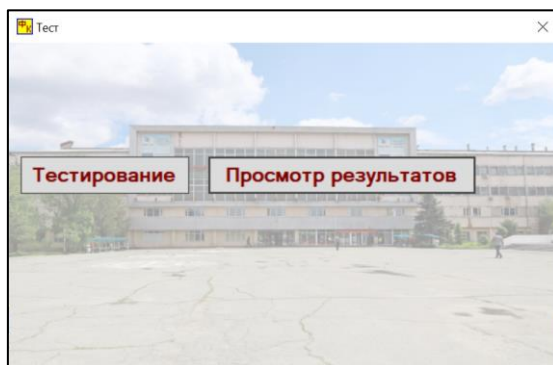
Рис.2. Окно выбора режима

При успешной авторизации приложение активирует следующее окно для выбора режима Тестирование (рис.2) или Просмотр результатов (рис.3). На мониторе появляется исходное окно (рис.4) с мультимедийными компонентами и информацией об общей длительности прохождения теста, а также сами варианты ответов на предлагаемый демонстрационный видеосюжет, из которых требуется выбрать правильную опцию и в авторежиме перейти к следующему видеоролику.