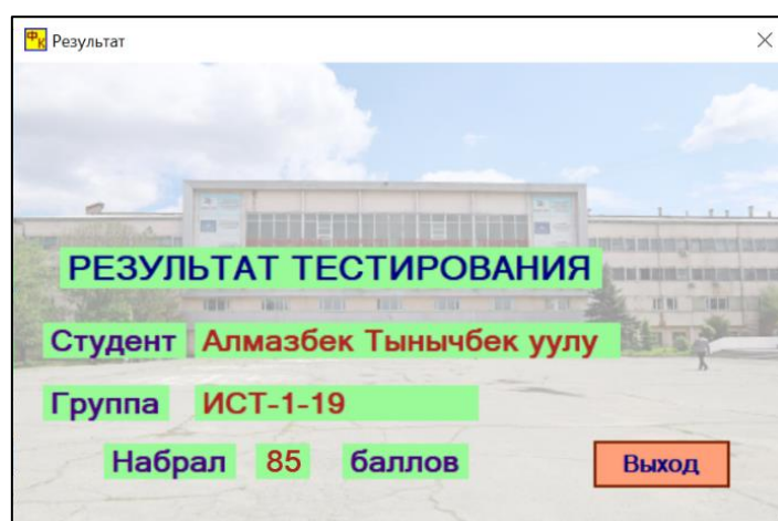
Рис.5. Окно представления результата проведенного тестирования

По завершению очередным студентом процедуры тестирования на мониторе всплывает окно (рис.5), в котором представлен полученный конкретный результат, оцененный в относительных баллах.