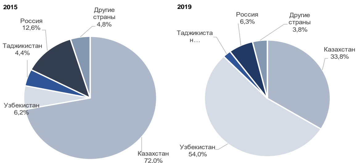
Рисунок 3. Количество прибытий границы КР иностранными гражданами

В 2019г. в сферу туризма привлечено около 158 млн. долларов США прямых иностранных инвестиций (без учета оттока), что в 2,6 раза больше, чем в 2018г., при этом из стран вне СНГ их поступило в 2,8 раза больше, из стран СНГ, напротив, в 5,8 раза меньше.