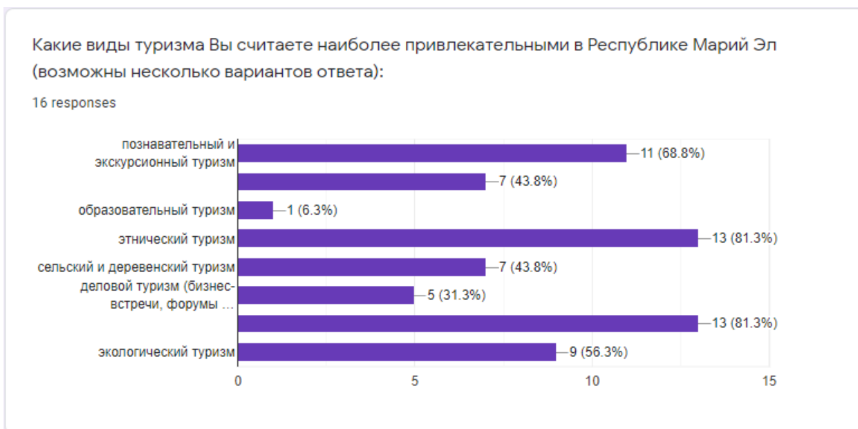
Рис. 3. Распределение ответов респондентов на вопрос: «Какой вид туризма наиболее привлекательный в Республике Марий Эл?»

Далее можно провести еще один показательный анализ, который свидетельствует о том, что представители турбизнеса, туристы воспринимают основную проблему, тормозящую сферу туризма как недостаток информации и продвижения того потенциала, который имеется, а представители муниципальных властей – отмечают как главную проблему – недостаток финансирования со стороны республиканской власти [2, С.40-43].