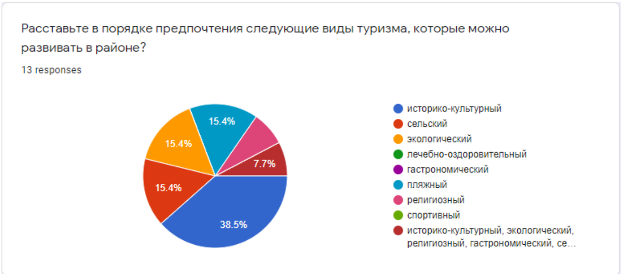
Рис. 2. Распределение ответов респондентов на вопрос: «Какой вид туризма следует развивать в вашем районе?»

Ниже приведено мнение представителей турбизнеса при ответе на данный вопрос (рис 3.). Очевидно, что практики отрасли более объективно оценивают имеющуюся ситуацию, и указывают на первых позициях: этнический, деловой и экскурсионный. Автор данной работы является специалистом по этнотуризму в Республике Марий Эл долгие годы, представляя турпотенциал республики по этнотуризму на международном и всероссийском уровне. К сожалению, следует констатировать тот факт, что развитию этнотуризма в Республике Марий Эл препятствует негативное отношение представителей марийского народа к привлечению внимания широкой общественности (туристы и т.д.) к марийской обрядности и марийской религии. Считается, что посещение священных роц людьми, не имеющими отношения к данной религии, приведет к осквернению духов и, в конечном итоге, к потере культурной идентичности марийского народа. Поэтому развитие этнотуризма в республике специально тормозится. Деловой туризм – это т.н. командировки, т.е. поездки на территорию республики исключительно по работе. Никаких серьезных конгрессных, либо выставочных мероприятий в республике никогда не проводилось. Следовательно, на 1 месте – развитие экскурсионного туризма.