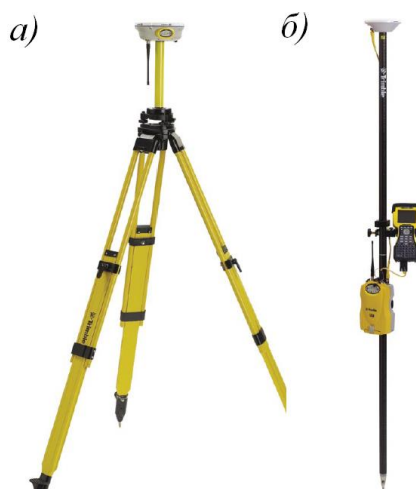
Рис. 1. Базовый (а) и мобильный (б) приемники

Методом статических спутниковых наблюдений определили координаты пунктов геодезического обоснования. Это наиболее надежный метод с точностью до миллиметра. Базовый приемник установили над исходной точкой с известными координатами на штатив, а мобильный поочередно устанавливали на пункты съемочной сети. При этом синхронизировали измерения базовым и мобильным приемниками.