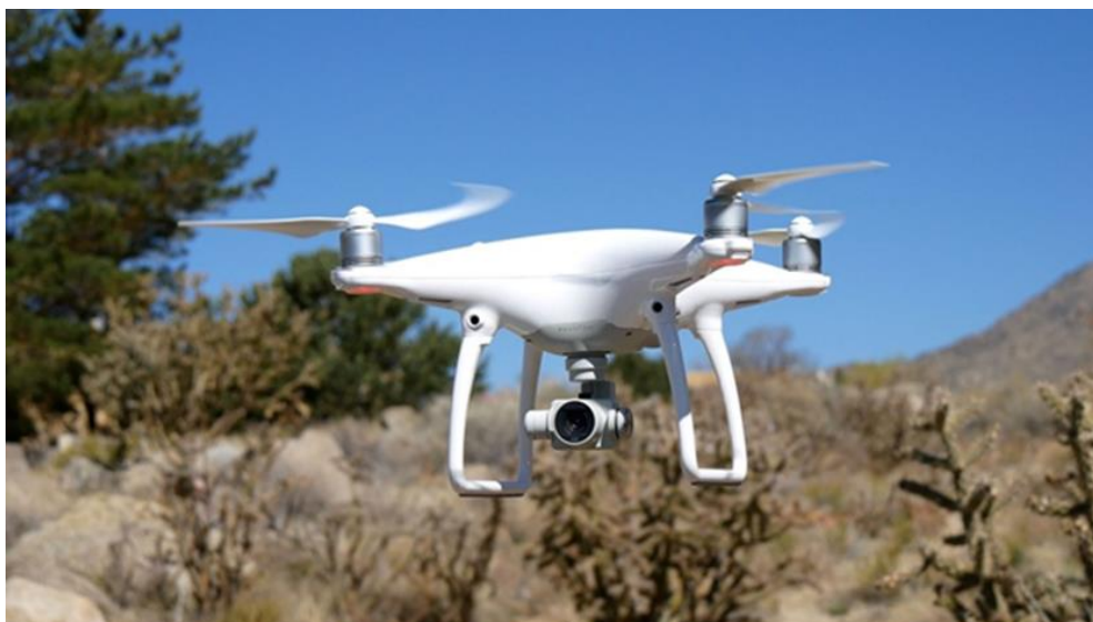
Рис. 2. БПЛА Phantom 4

На местности закрепляем белые маркировки, хорошо заметные с высоты. Координаты маркировок мы определили с помощью GPS приемника. Далее проверяем работу камеры и вывод телеметрии, калибруем навигационные устройства, настраиваем БПЛА для полета по заданной траектории.