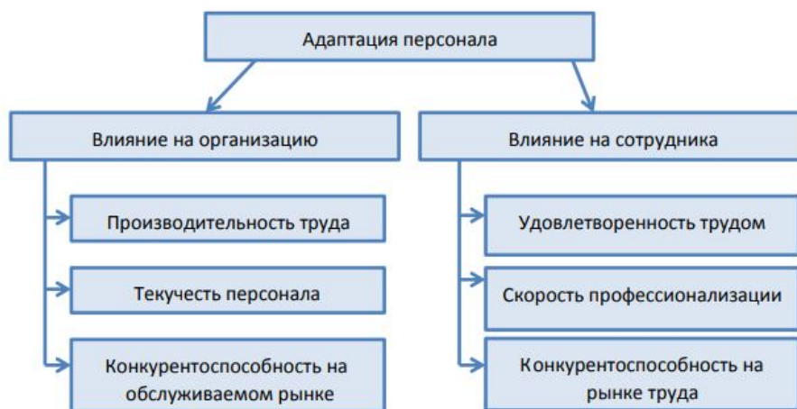
Рисунок 1. Показатели эффективности адаптации персонала

Ответим на этот вопрос рисунком 1, на котором изображены направления по влиянию процесса адаптации на общие показатели предприятия.