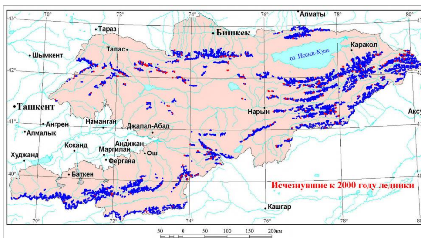
Рис. 1. Карта Института водных проблем и гидроэнергетики Национальной академии наук Кыргызской Республики [6.1].

Введение. Кыргызская Республика - единственная страна в Центральной Азии, водные ресурсы которой полностью формируются на собственной территории, в этом ее гидрологическая особенность и преимущество. Кыргызстан обладает значительными ресурсами подземных и наземных вод, запасы которых находятся в реках, вечных ледниках и снежных массивах. Ледники являются основным источником водных и гидроэнергетических ресурсов Кыргызской Республики.