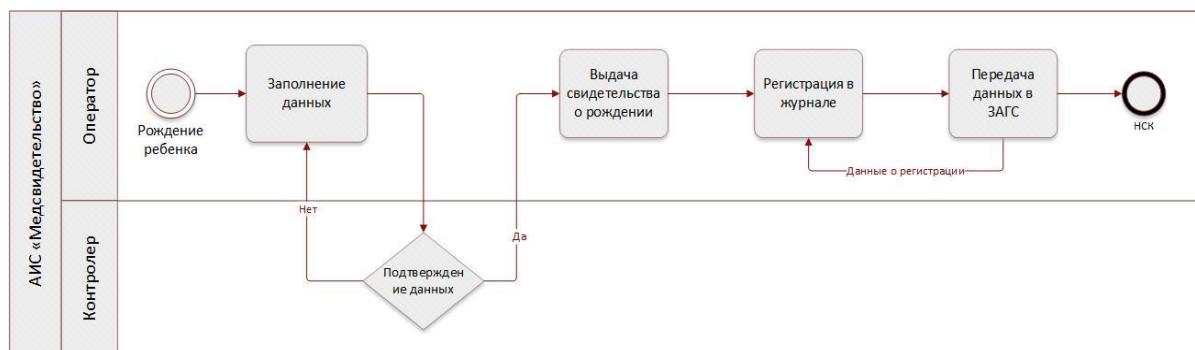
Рис. 2. Схема потока данных свидетельства о рождении

При разработке информационной системы "Медицинское свидетельство" были использованы следующие технологии: