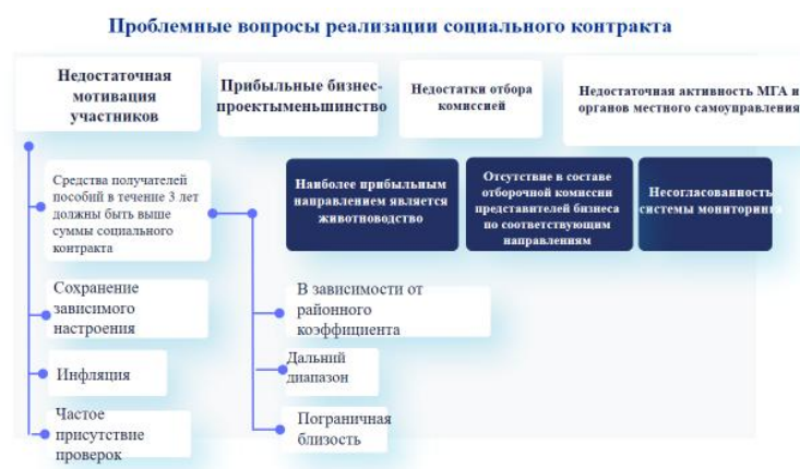
Рис.2. Проблемные вопросы социального контракта

В 2024 году 20 000 семей получают средства из республиканского бюджета (2,0 млрд сомов), 3000 семей из Всемирного банка (300,0 млн. сомов). сомов). Также министерство планирует автоматизировать работу по социальному контракту в рамках Всемирного банка.