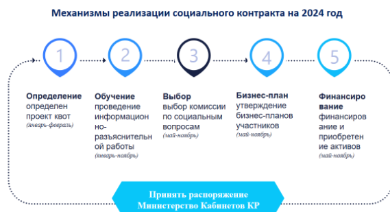
Рис.3. Механизмы реализации социального контракта на 2024 год

В настоящее время количество получателей социальной помощи по социальному контракту